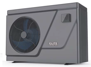
Elite Inverter hőszivattyú