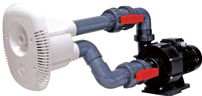
Brilix Swim Jet Elegance