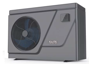
Elite Inverter hőszivattyú