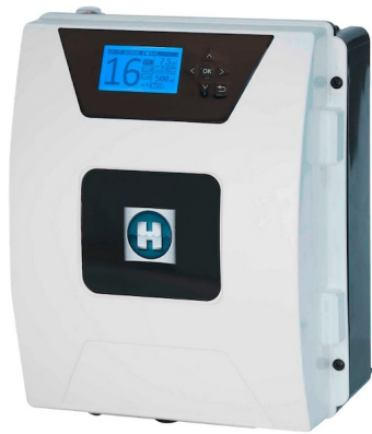
Aquarite Flo sóbontó cella