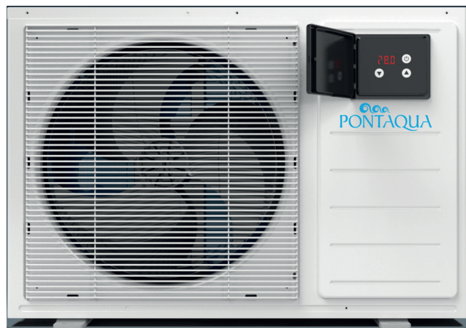
Pontaqua Ecolux hűszivattyú