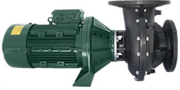
PSH D-Giant-N Szivattyú